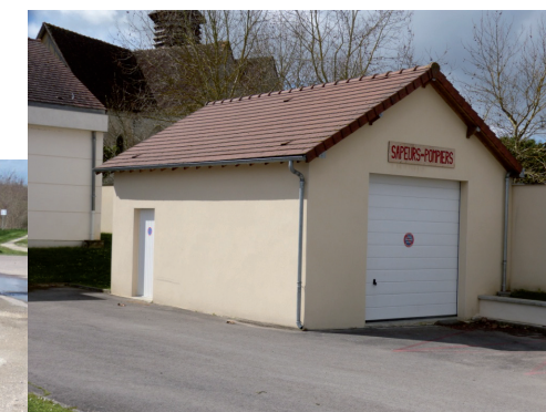
Agrandir le local des pompiers