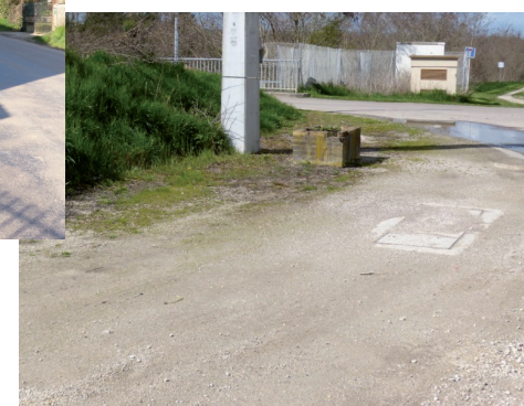
Aménager d' un abri-bus pour les collégiens