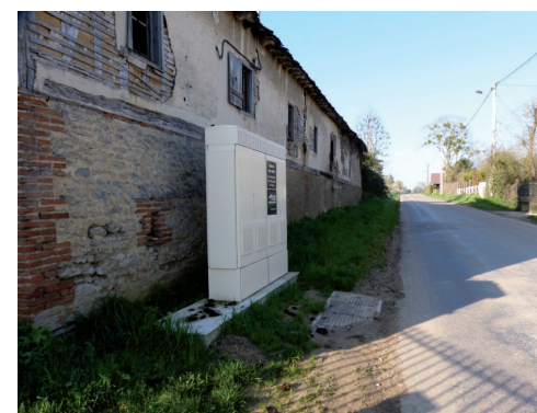
Aménager un chemin piétonnié rue Saint-Loup