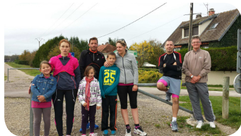
Une partie des «coureurs» et «marcheurs» du 9 novembre.

Suite au dernier Rouilly-Saint-Loup'Infos, un petit groupe de personnes s'est réuni pour mettre en place un atelier «photo». Si vous êtes intéressés, il n'est pas d'autre tard pour vous inscrire : vous pouvez contacter la secrétaire de mairie qui fera le relais.