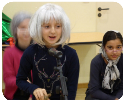
Représentation théâtrale au Noël des enfants