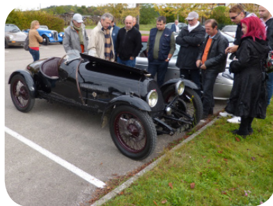
Rassemblement automobile mensuel Prochaines dates : 15 février et 15 mars