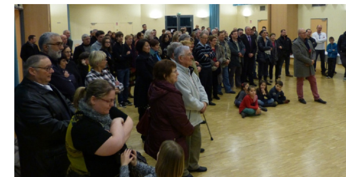
De nombreux lupirulliens avaient fait le déplacement pour cette première cérémonie des vœux.