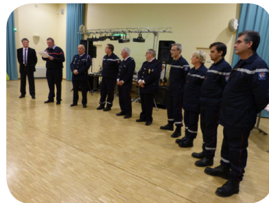
La Sainte-Barbe du 6 décembre